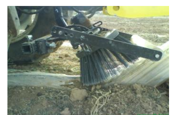
Matura 800 mm.