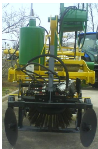
Vedere frontala cu totul inclus