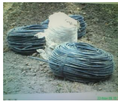
Furtun de picatura adunat