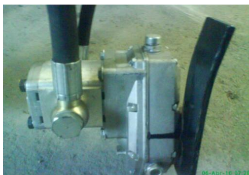
Pompa si distribuitor de ulei