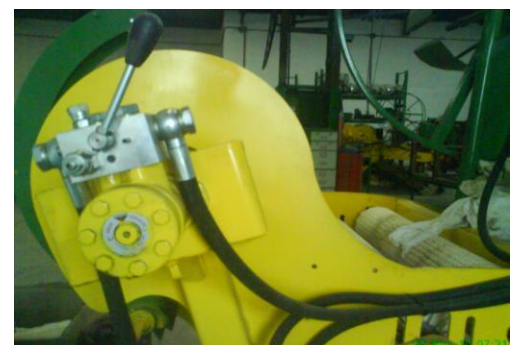
Regulator viteza la adunarea plasticului