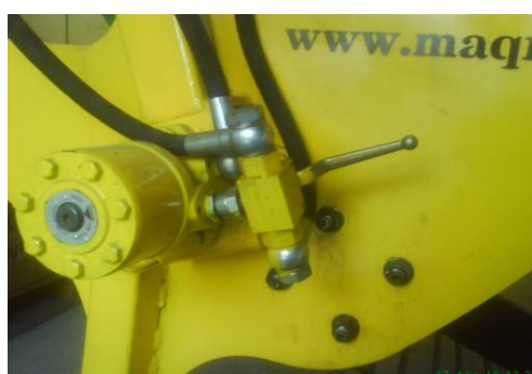
Cheie de schimb de intors furtunul